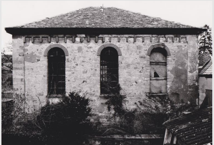
Fotodokumentation 1990er Jahre, Hofseite

In seinem Vortrag wird Berthold Schnabel die Geschichte des Bethauses (im Hof des Anwesens Feis am Markplatz 4-6, aus dem 18. Jahrhundert) und der Synagoge (Bahnhofstraße 19, 1854 eingeweiht) aufzeigen und in die Entwicklung der jüdischen Gemeinde in Deidesheim einbinden.